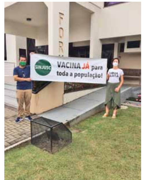
Comarca de Indaial