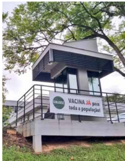
Comarca de Blumenau

“Ninguém se salva sozinho se não salvar todos”