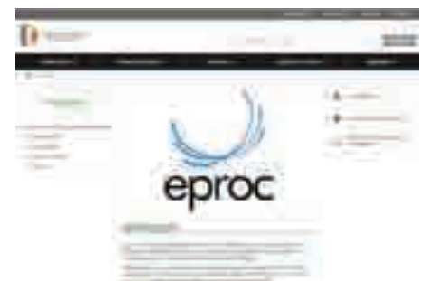
Trabalhador quer saber efeitos

O Poder Judiciário de Santa Catarina usará o e-proc, sistema desenvolvido pela Justiça Federal para agilizar o andamento de processos e tentar dar uma respostas mais rápida a cidadãos que buscam a aplicação da lei. A questão é se o eproc vai dar os mesmos resultados em ambientes tão diferentes. No judiciário federal, por exemplo, são 17 pessoas atuando em um setor semelhante ao que é um cartório no Poder Judiciário estadual. Além disto, na Justiça Federal não tem nenhum comissiona-