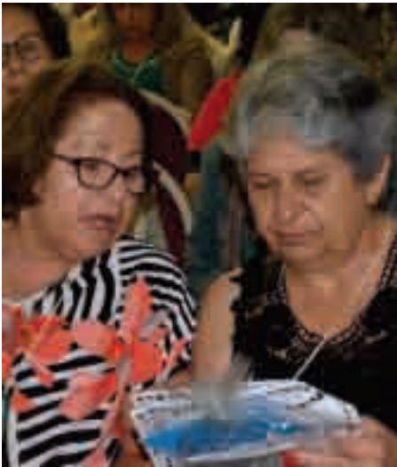
NAP busca ampliar a organização e a participação em todo o Estado

O Núcleo de Aposentados e Pensionistas (NAP) do SINJUSC realiza o 13º Encontro da Experiência, dias 20, 21 e 22 de agosto no Hotel Marambaia, em Balneário Camboriú. Além de uma oportunidade de encontro de amigos e colegas do Poder Judiciário, o evento tem palestras sobre políticas públicas para quem mais de 60 anos e uma apresentação com Eduardo Bolina. O Núcleo realiza uma assembleia geral, para apresentar