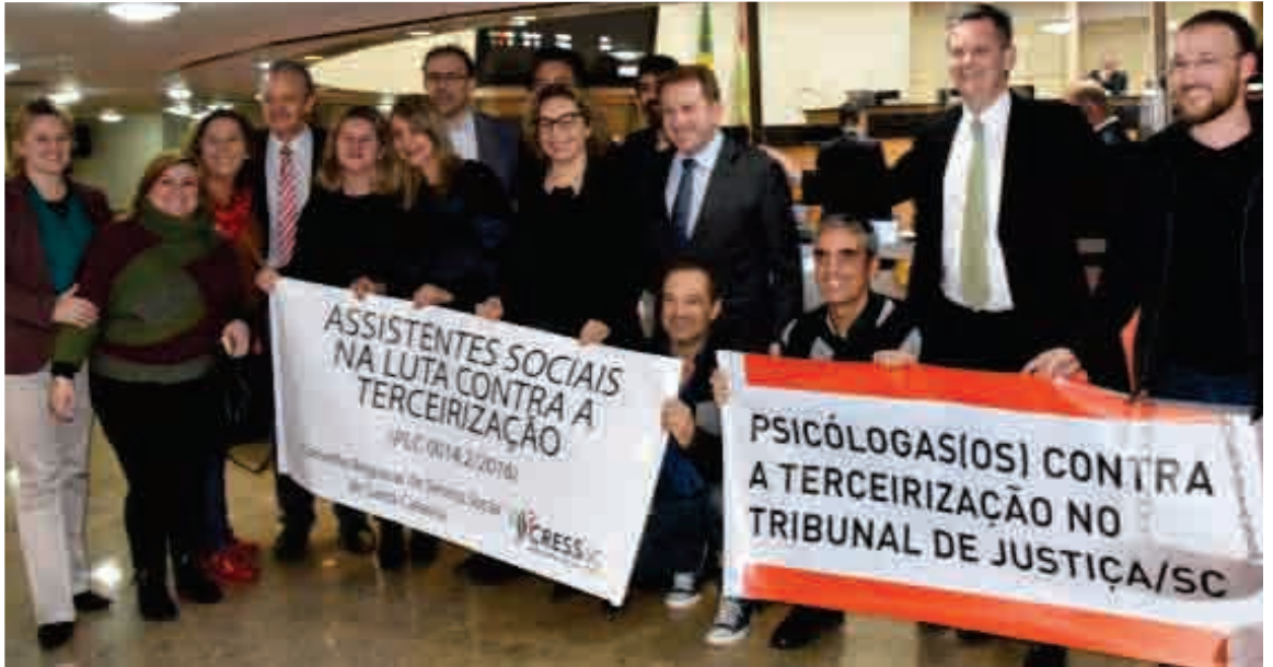
Sindicato esteve presente em todos os momentos na defesa do concurso público

Com a luta de todos os trabalhadores e trabalhadoras, a Assembleia Legislativa derrubou, na sessão plenária de 10 de julho, o texto do Projeto de Lei Complementar (PLC) 14.2/2016 que autorizava o Poder Judiciário a terceirizar as funções de assistentes sociais e psicólogos/as.