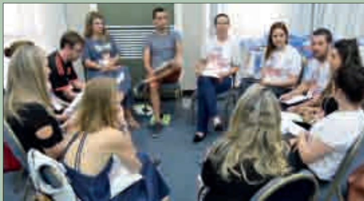
Plantão judicial foi tema de amplos debates na Conferência

É agora a hora de mostrar o que querem os trabalhadores e trabalhadoras do Poder Judiciário: uma solução definitiva para a disfunção dos Agentes, o nível superior dos Técni-