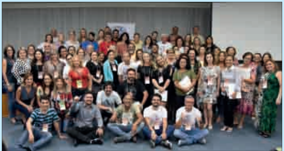
Seminários de alto nível e debate sobre temas importantes para a categoria

As principais lutas apontadas pela Conferência e assembleia foram para resolver a disfunção dos agentes, o nível superior dos técnicos, o adicional de qualificação para os cargos de nível superior, a valorização dos aposentados, o plantão judicial, a URV e a VPNI.